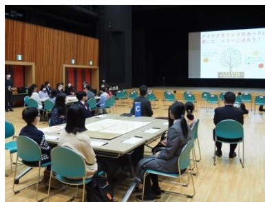
オリエンテーション