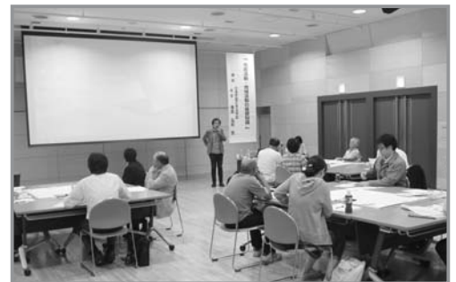
市民活動等入門講座の様子

・講話テーマ：「モノ」から「コト」へ、ストーリーの大切さ / 活動が動き出すための仲間をつくる秘訣