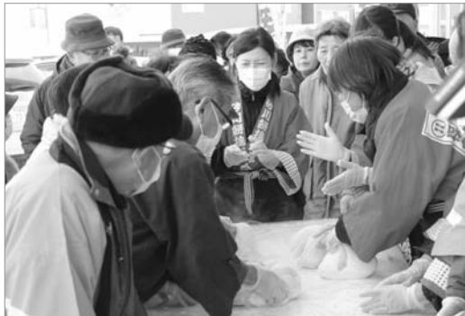
●皆さんにふるまうもちをこねています

「安全をのばそう 災害をたたきつぼう!」をスローガンに、もちつき保存会による「街頭もちつき」が市内各所で行われました。皆さんに見守られるなか、冬の寒さにも負けず一生懸命ついたもちは、安全もちとして皆さんにふるまわれました。来年も無病息災で良い年になりますように。