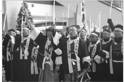
●勝ちどきで病気を断ち斬る!

赤穂義士討ち入りの日、第61回北海道義士祭が開かれ、墓前法要などが行われたほか、新たに忠臣蔵のワンシーンを再現したミニ芝居が披露され、勝ちどきまでの歴史を振り返りました。また、空知太保育所などを慰問し、市立病院を訪れた義士は患者の皆さんに病気を断ち斬る力強い勝ちどきを送りました。