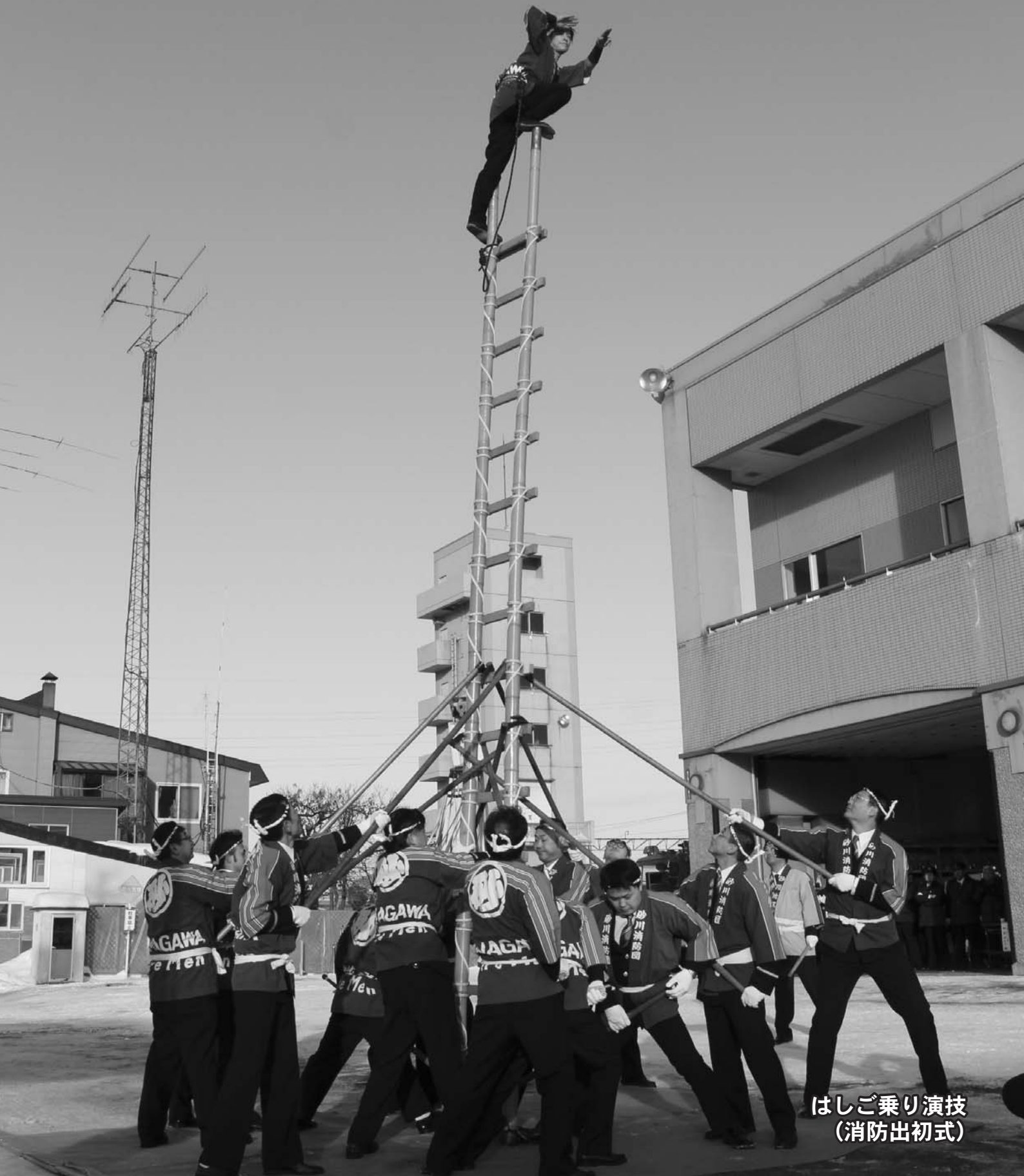
はしご乗り演技 (消防出初式)