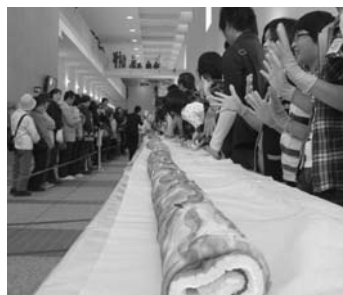
広いロビーを使用して、50mのロールケーキを作りました(平成22年)

「ニューイヤークンサート」、落語や演劇などの公演に利用されています。また、調理機器が完備されている食品工房では「手打ちそば講座」などの調理を行うイベントにも利用されています。これからも皆さんのイベント参加や貸館利用をお待ちしています。