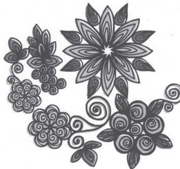
▲ペーパークイリングで作るお花のイメージ。専用の紙を丸めて組み合わせます。

細長い紙を丸めた渦巻き状のパーツを組み合わせ、花や動物などの形に仕上げるペーパークラフトです。