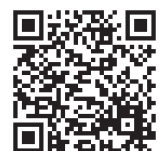
子供のSOSの 相談窓口 (文科省 HP)