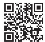
よりそいホット ライン HP