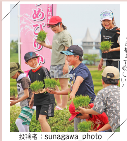
初めての田植えで楽しい！