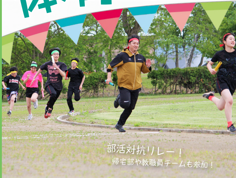
部活対抗リレー！ 帰宅部や教職員チームも参加！