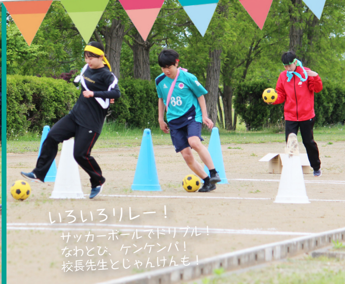
いろいろリレー！ サッカーボールでドリブル！ なわとび、ケンケンパ！ 校長先生とじゃんけんも！

編集後記 ▼田植え体験の取材に行ってきました▼ 私も子どものころに体験しましたが、泥の中がとても気持ち良かったことを今でも覚えています▼普段経験することができないことはいない出になりますよね▼ 今回子どもたちが植えた苗は秋ごろ収穫予定となっていますが、成長が待ち遠しいですね！ ②