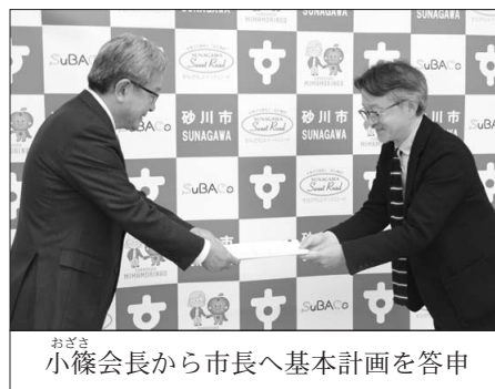
おごさ 小篠会長から市長へ基本計画を答申