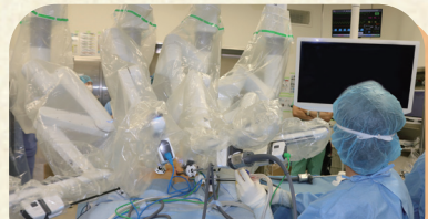
手術支援ロボット「ダヴィンチ」