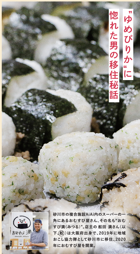
砂川市の複合施設AiAi内のスーパーの一角にあるおますび屋さん、その名も”おますび満(みつる)”。店主の 船田 満さん(以下、船)は大阪府出身で、2019年に地域おこし協力隊として砂川市に移住、2020年におますび屋を開業。