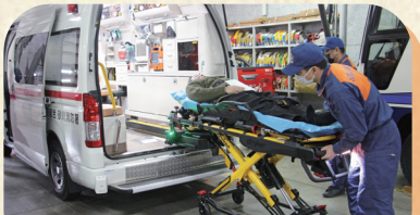
高規格救急自動車