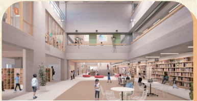
砂川学園校舎内観 R8.4月開校予定