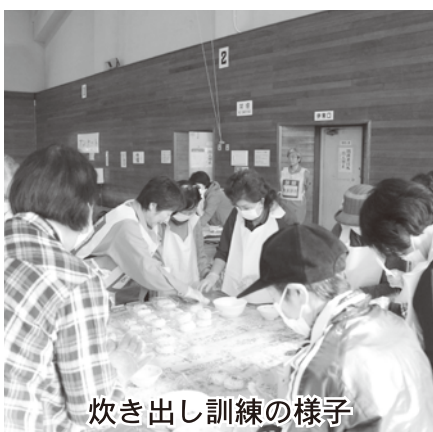
炊き出し訓練の様子

問 高齢者や女性など配慮が必要な方を対象とした避難所について。 答 女性については、男女別の更衣室を作り、授乳室にも活用するなど、プライバシーに配慮し、心身に衰えのある方などは、病院又は福祉避難所への移送も視野に入れています。